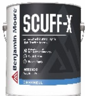
SCUFF-X® Interior Eggshell Finish N485

Wodorozcieńczalna, lateksowa farba akrylowa z innowacyjną, opatentowaną technologią „Scuff-Resistant” odporna na czarne ślady i przetarcia, przeznaczona do malowania ścian wewnętrznych w przestrzeniach o wysokim natężeniu ruchu. Półmat.