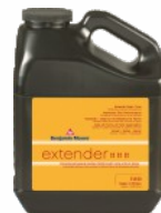
BENJAMIN MOORE® Extender 518

Opakowania: 3,78 l (zestaw emalia/utwardzacz - po zmieszaniu 3,78 l).