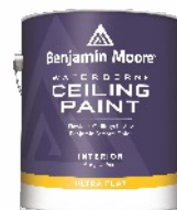
WATERBORNE Ceiling Paint 508

Wodorozcieńczalna, wewnętrzna farba akrylowa z technologią rozpraszania refleksów świetlnych przeznaczona do dekoracji sufitów. Ultra-mat.