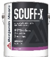
SCUFF-X® Interior Matte Finish N484

Wodorozcieńczalna, lateksowa farba akrylowa z innowacyjną, opatentowaną technologią „Scuff-Resistant” odporna na czarne ślady i przetarcia, przeznaczona do malowania ścian wewnętrznych w przestrzeniach o wysokim natężeniu ruchu. Mat.