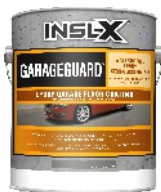
GARAGEGUARD® Low Odor Water Based 2 Part Epoxy Semi Gloss EGG-XXX

Nowej generacji, wodorozcieńczalna, dwuskładnikowa emalia epoksydowa do malowania posadzek betonowych ekspozowanych wewnątrz budynków. Półpołysk.