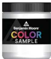
COLOR SAMPLE 200