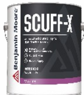
SCUFF-X® Interior Matte Finish N484

Wodorozcieńczalna, lateksowa farba akrylowa z innowacyjną, opatentowaną technologią „Scuff-Resistant” odporna na czarne ślady i przetarcia, przeznaczona do malowania ścian wewnętrznych w przestrzeniach o wysokim natężeniu ruchu. Mat.