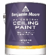
WATERBORNE Ceiling Paint 508

Wodorozcieńczalna, wewnętrzna farba akrylowa z technologią rozpraszania refleksów świetlnych przeznaczona do dekoracji sufitów. Ultra-mat.