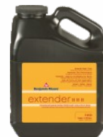
BENJAMIN MOORE® Extender 518

Opakowania: 3,78 l (zestaw emalia/utwardzacz - po zmieszaniu 3,78 l).