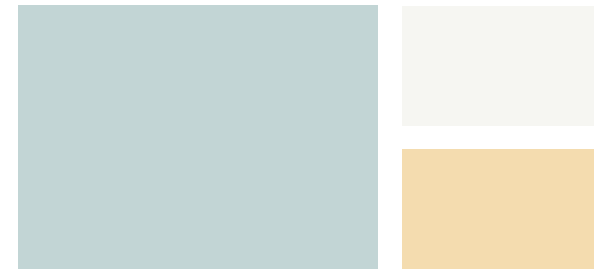
Wall: Fantasy Blue 716 Trim: Chantilly Lace OC-65 Accent: Harp Strings 213 Pared: Azul de Fantasía 716 Marco: Encaje de Chantilly OC-65 Acento: Cuerdas de Arpa 213