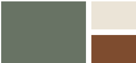
Wall: Cushing Green HC-125 Trim: White Down OC-131 Accent: Satchel AF-240