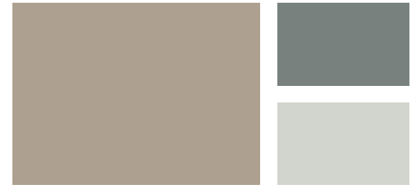
Wall: Indian River 985 Trim: Night Train 1567 Accent: Gray Cashmere 2138-60 Pared: Río Indio 985 Marco: Tren de la Noche 1567 Acento: Cachemira Gris 2138-60