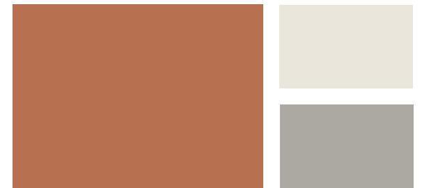
Wall: Firenze AF-225 Trim: Dove Wing OC-18 Accent: Cape May Cobblestone 1474 Pared: Florencia AF-225 Marco: Ala de Paloma OC-18 Acento: Adoquín de Cape May 1474