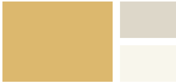
Wall: California Hills 216 Trim: Ashwood OC-47 Accent: Simply White OC-117