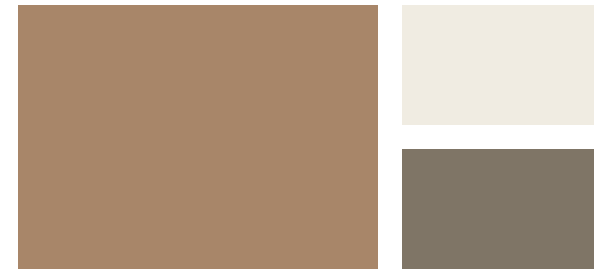
Wall: Jackson Tan HC-46 Trim: Swiss Coffee OC-45 Accent: Cromwell Gray HC-103