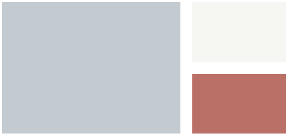
Wall: Feather Gray 2127-60 Trim: Chantilly Lace OC-65 Accent: Persimmon 2088-40 Pared: Gris de Pluma 2127-60 Marco: Encaje de Chantilly OC-65 Acento: Placaminero 2088-40