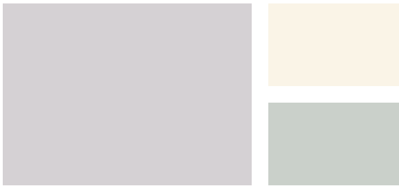
Wall: Slip AF-605 Trim: Mayonnaise OC-85 Accent: Quiet Moments 1563 Pared: Enagua AF-605 Marco: Mayonesa OC-85 Acento: Momentos Tranquilos 1563