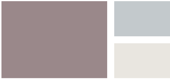
Wall: Wet Concrete 2114-40 Trim: Silver Half Dollar 2121-40 Accent: Lacey Pearl 2108-70