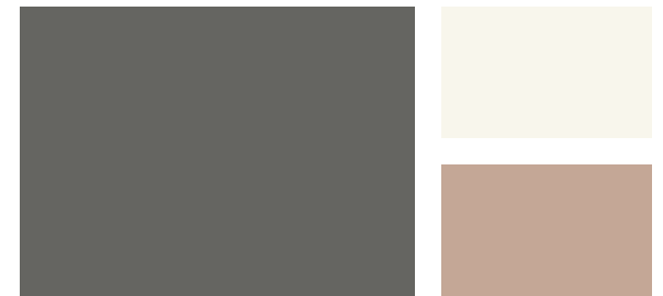
Wall: Kendall Charcoal HC-166 Trim: Vapor AF-35 Accent: Venetian Portico AF-185