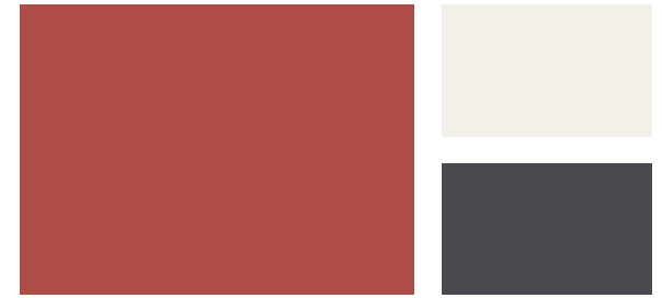
Wall: Rosy Apple 2006-30 Trim: Alabaster OC-129 Accent: Day's End 2133-30