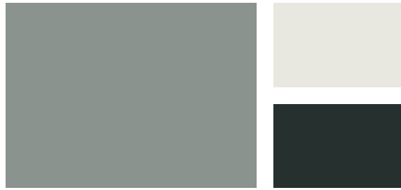
Wall: Stonybrook 1566 Trim: White Wisp 2137-70 Accent: Black Forest Green HC-187