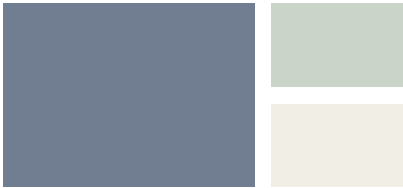
Wall: Luxe AF-580 Trim: Crystalline AF-485 Accent: White Dove OC-17