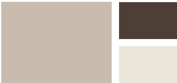
Wall: Annapolis Gray HC-176 Trim: Mink 2112-10 Accent: Soft Chamois OC-13 Pared: Gris de Annapolis HC-176 Marco: Visón 2112-10 Acento: Gamuza Suave OC-13